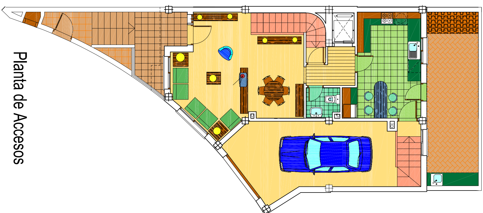
Planta de Accesos